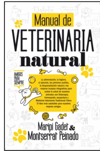
Manual de veterinaria natural

Maripi Gadet Castaño Montserrat Peinado Rodríguez 14.5x22 cm 160 p. Ilustrado · PVP 17.95