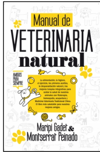
Manual de veterinaria natural

Maripi Gadet Castaño Montserrat Peinado Rodríguez 14.5x22 cm 160 p. Ilustrado · PVP 17.95