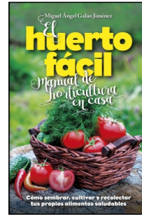
El huerto fácil. Manual de horticultura en casa

Miguel Ángel Galán Jiménez 224 p. Ilustrado · PVP 19.95