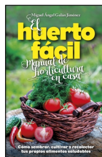
El huerto fácil.