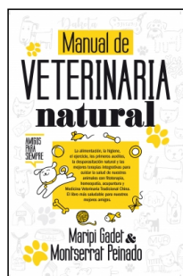
Manual de veterinaria natural