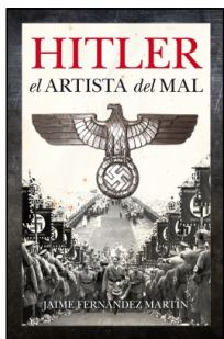
Hitler, el artista del mal

JAIME FERNÁNDEZ MARTÍN 14.5x22 cm 336 p. PVP 21.95