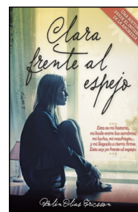
Clara frente al espejo

Belén Olías Ericsson 14.5x22 cm 96 p. PVP 11.95