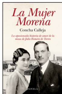
La Mujer Morena