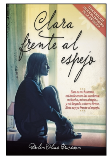
Clara frente al espejo

Belén Olías Ericsson 14.5x22 cm 96 p. PVP 11.95