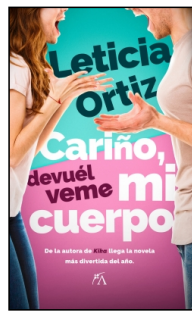
Cariño, devuélveme mi cuerpo