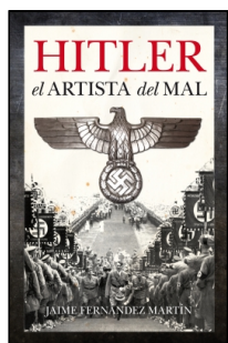
Hitler, el artista del mal

JAIME FERNÁNDEZ MARTÍN 14.5x22 cm 336 p. PVP 21.95