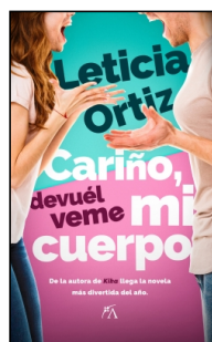
Cariño, devuélveme mi cuerpo