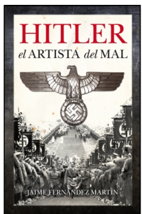
Hitler, el artista del mal

JAIME FERNÁNDEZ MARTÍN 14.5x22 cm 336 p. PVP 21.95