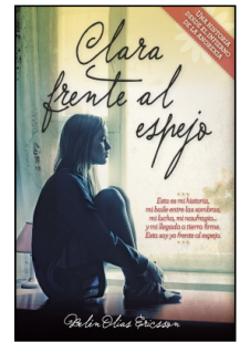
Clara frente al espejo

Belén Olías Ericsson 14.5x22 cm 96 p. PVP 11.95