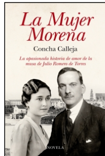
La Mujer Morena