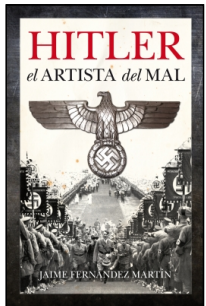
Hitler, el artista del mal

JAIME FERNÁNDEZ MARTÍN 14.5x22 cm 336 p. PVP 21.95