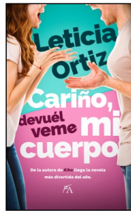
Cariño, devuélveme mi cuerpo