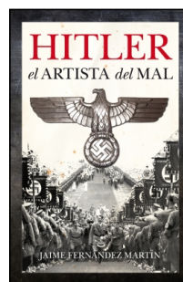
Hitler, el artista del mal

JAIME FERNÁNDEZ MARTÍN 14.5x22 cm 336 p. PVP 21.95