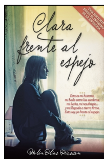
Clara frente al espejo

Belén Olías Ericsson 14.5x22 cm 96 p. PVP 11.95