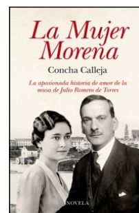
La Mujer Morena