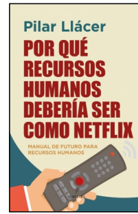
Por qué Recursos Humanos debería ser como Netflix

Pilar Llácer 14x21 cm 192 p. Ilustrado · PVP 17.95