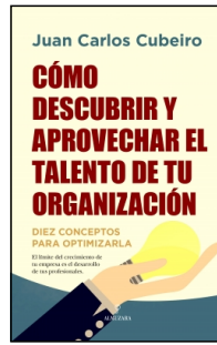
Cómo descubrir y aprovechar el talento de tu organización