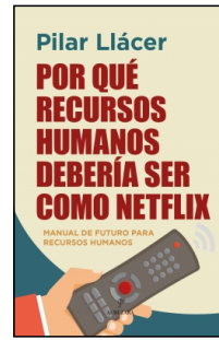
Por qué Recursos Humanos debería ser como Netflix