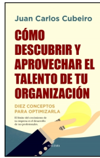
Cómo descubrir y aprovechar el talento de tu organización