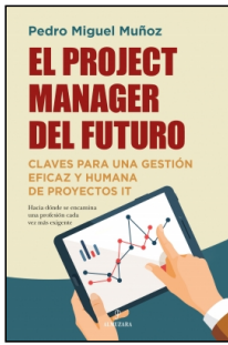
El project manager del futuro

Pedro Miguel Muñoz Ureña 14x21 cm 144 p. PVP 15.95