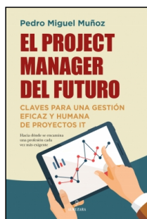
El project manager del futuro