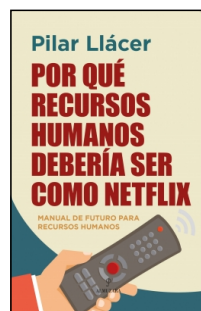
Por qué Recursos Humanos debería ser como Netflix