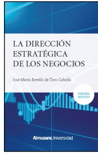
La dirección estratégica los negocios