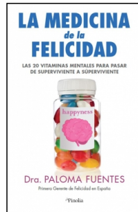
La medicina de la felicidad