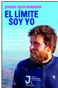
El límite soy yo

Jonas Deichmann 15x23 cm 256 p. PVP 26.95