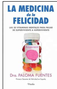
La medicina de la felicidad