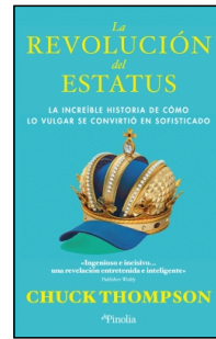
La revolución del estatus

Chuck Thompson 15x23 cm 296 p. PVP 25.95