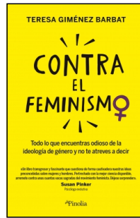
Contra el feminismo

Teresa Giménez Barbat 15x23 cm 352 p. PVP 27.95