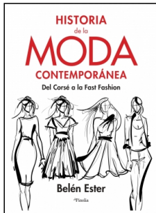
Historia de la moda contemporánea

Belen Ester 16.5x26.5 cm 192 p. Ilustrado · PVP 19.95