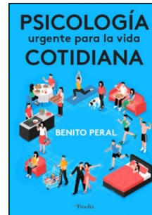
Psicología urgente para la vida cotidiana