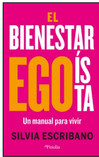
El bienestar egoísta

Silvia Escribano 15x23 cm 224 p. PVP 24.95