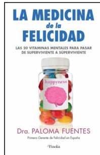
La medicina de la felicidad