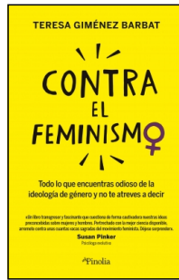
Contra el feminismo

Teresa Giménez Barbat 15x23 cm 352 p. PVP 27.95