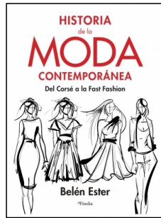
Historia de la moda contemporánea

Belen Ester 16.5x26.5 cm 192 p. Ilustrado · PVP 19.95