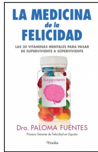
La medicina de la felicidad