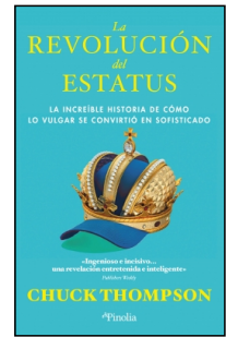
La revolución del estatus

Chuck Thompson 15x23 cm 296 p. PVP 25.95