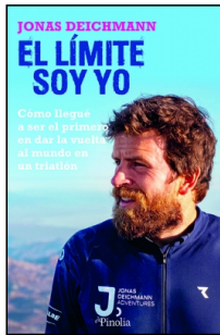
El límite soy yo

Jonas Deichmann 15x23 cm 256 p. PVP 26.95