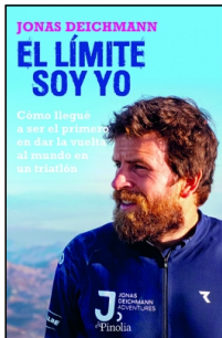
El límite soy yo

Jonas Deichmann 15x23 cm 256 p. PVP 26.95