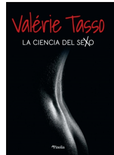
La ciencia del sexo