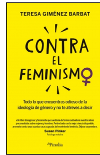
Contra el feminismo

Teresa Giménez Barbat 15x23 cm 352 p. PVP 27.95