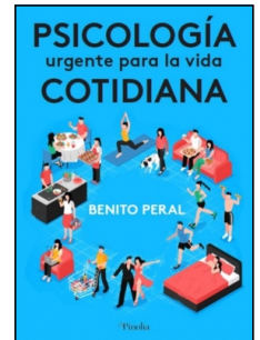
Psicología urgente para la vida cotidiana