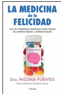
La medicina de la felicidad