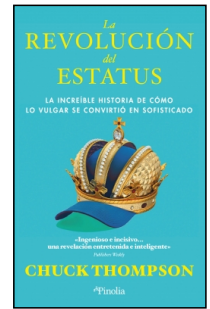
La revolución del estatus

Chuck Thompson 15x23 cm 296 p. PVP 25.95