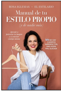
Manual de tu estilo propio