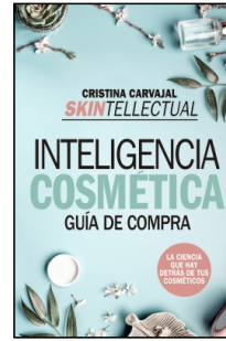
Skintellectual. Inteligencia cosmética