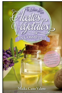
Tu guía de los aceites vegetales en cosmética