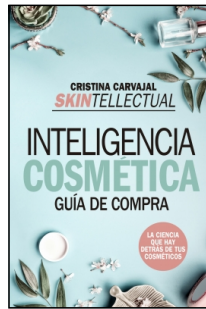
Skintellectual. Inteligencia cosmética