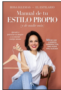
Manual de tu estilo propio