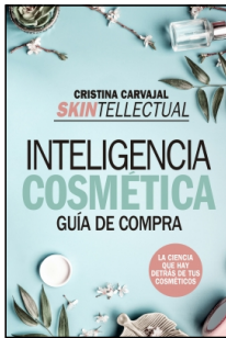
Skintellectual. Inteligencia cosmética

Cristina Carvajal Riola 14.5x22 cm 160 p. Ilustrado · PVP 15.95