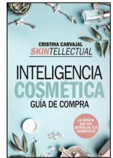
Skintellectual. Inteligencia cosmética

Cristina Carvajal Riola 14.5x22 cm 160 p. Ilustrado · PVP 15.95