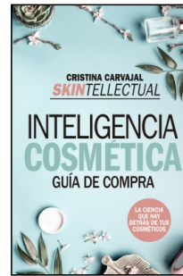
Skintellectual. Inteligencia cosmética