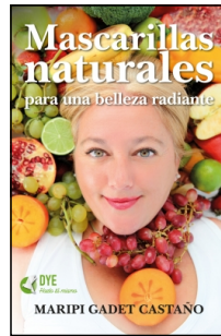
Mascarillas naturales para una belleza radiante

Maripi Gadget Castaño 14.5x22 cm 160 p. Ilustrado · PVP 17.95