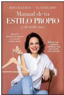
Manual de tu estilo propio