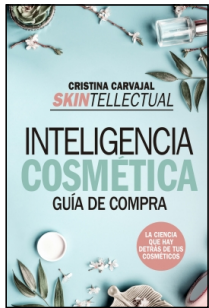
Skintellectual. Inteligencia cosmética

Cristina Carvajal Riola 14.5x22 cm 160 p. Ilustrado · PVP 15.95