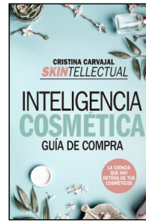
Skintellectual. Inteligencia cosmética