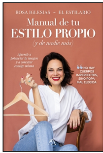
Manual de tu estilo propio