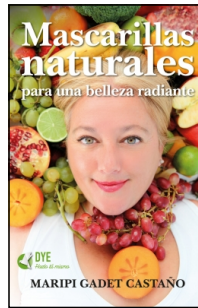
Mascarillas naturales para una belleza radiante

Maripi Gadet Castaño 14.5x22 cm 160 p. Ilustrado · PVP 17.95