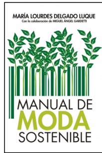
Manual de moda sostenible

María Lourdes Delgado Luque 14.5x22 cm 208 p. Ilustrado · PVP 21.00