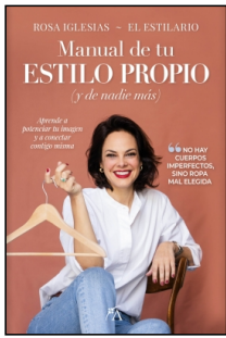
Manual de tu estilo propio