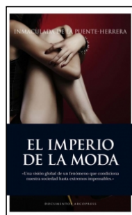
El imperio de la moda