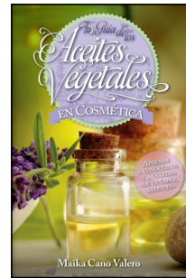
Tu guía de los aceites vegetales en cosmética