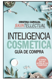
Skintellectual. Inteligencia cosmética