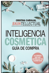
Skintellectual. Inteligencia cosmética

Cristina Carvajal Riola 14.5x22 cm 160 p. Ilustrado · PVP 15.95