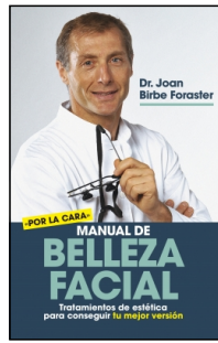
Manual de belleza facial

Joan Birbe Foraster 14.5x22 cm 176 p. Ilustrado · PVP 17.95