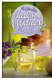
Tu guía de los aceites vegetales en cosmética