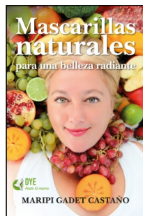
Mascarillas naturales para una belleza radiante

Maripi Gadet Castaño 14.5x22 cm 160 p. Ilustrado · PVP 17.95