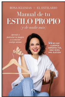
Manual de tu estilo propio