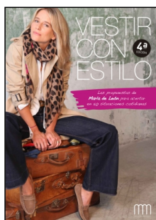
Vestir con estilo

MarÃ-a LeÃ³n Castillejo 208 p. PVP 24.00