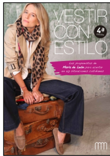
Vestir con estilo

MarÃ-a LeÃ³n Castillejo 208 p. PVP 24.00