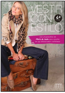
Vestir con estilo