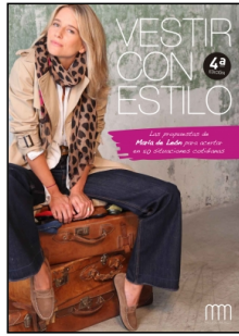
Vestir con estilo