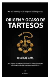
Origen y ocaso de Tartesos

José Ruiz Mata 15x24 cm 328 p. Ilustrado · PVP 23.95