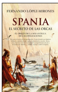
Spania, el secreto de las orcas

Fernando López-Mirónes 15x24 cm 360 p. Ilustrado · PVP 21.95