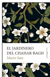
El jardinero del Chahar-Bagh