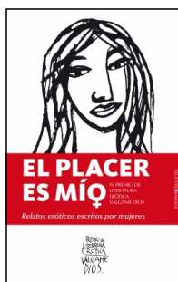
El placer es mío. Relatos eróticos escritos por mujeres