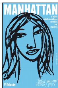
Manhattan y otros relatos eróticos escritos por mujeres