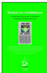
Relatos en verdiblanco