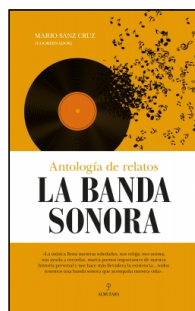
La banda sonora