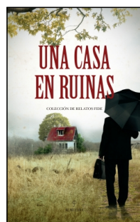
Una casa en ruinas