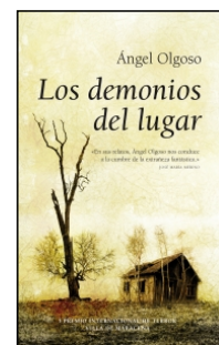
Los demonios del lugar