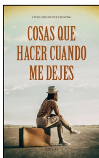
Cosas que hacer cuando me dejes

AA.VV. 14.5x22 cm 240 p. Ilustrado · PVP 19.95