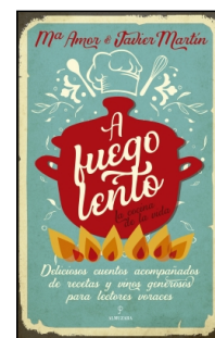
A fuego lento. La cocina de la vida