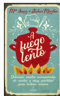
A fuego lento. La cocina de la vida