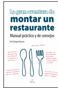
La gran aventura de montar un restaurante