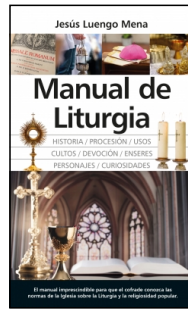
Manual de Liturgia