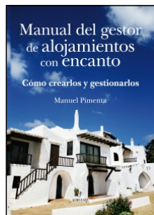
Manual del gestor de alojamientos con encanto