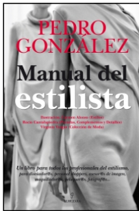
Manual del estilista