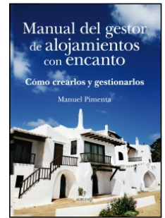
Manual del gestor de alojamientos con encanto