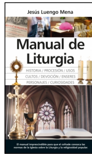
Manual de Liturgia