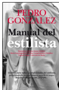
Manual del estilista