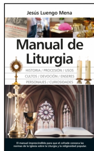
Manual de Liturgia