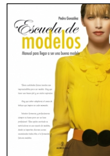
Escuela de modelos

Juan Pablo Rodríguez Frade 14.5x22 cm 256 p. Ilustrado · PVP 19.95