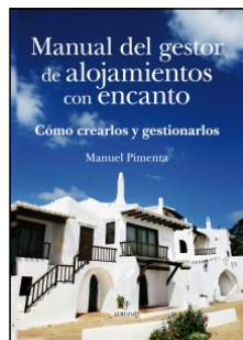
Manual del gestor de alojamientos con encanto