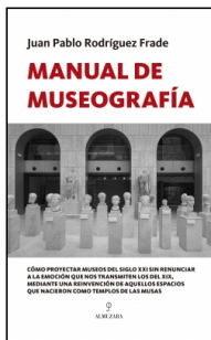
Manual de Museografía