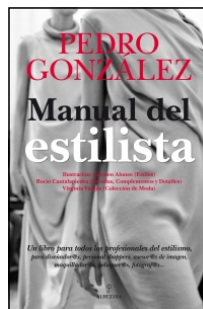
Manual del estilista