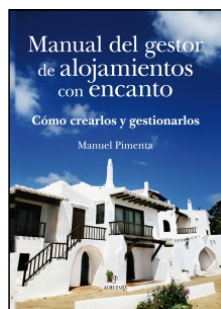
Manual del gestor de alojamientos con encanto