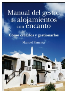
Manual del gestor de alojamientos con encanto