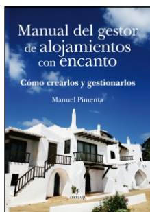
Manual del gestor de alojamientos con encanto