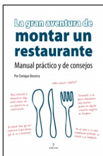
La gran aventura de montar un restaurante

Pedro González 144 p. PVP 28.00 9788496968042